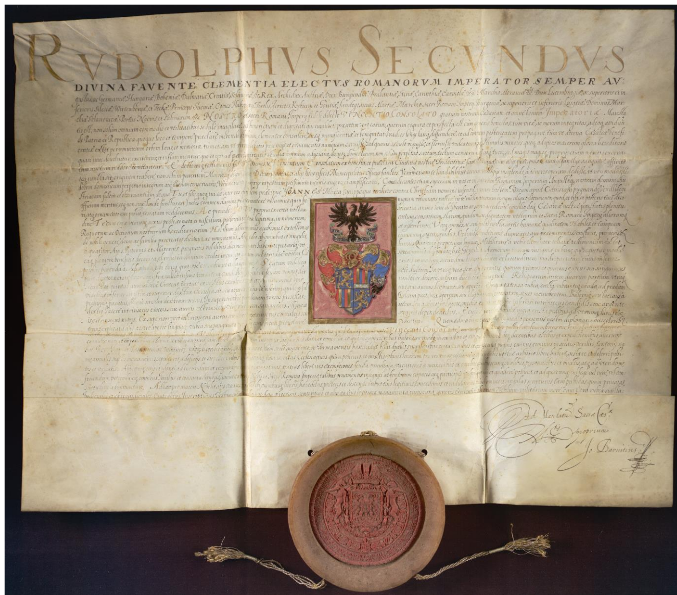
Diploma di nobiltà imperiale, 1603 ottobre 4 (Consolati, 400.4)

I Consolati, originari di Volano in Val Lagarina si trasferirono a Trento nella prima metà del Cinquecento, furono insigniti della nobiltà imperiale da Rodolfo II nel 1603 e nel 1790 ottennero il titolo di conti dell'Impero. Grazie al matrimonio avvenuto nella seconda metà del Settecento fra Pietro Antonio Consolati e Gioseffa Guarienti, all'estinzione della linea maschile della famiglia della sposa, nel 1836 i Consolati ereditarono il castello di Seregnano (Civezzano), proprietà dei Guarienti dal XVI secolo, e lo adibirono a residenza estiva. L'archivio, fino al 2015 custodito presso quella sede, contiene dunque documenti prodotti da entrambe le stirpi.