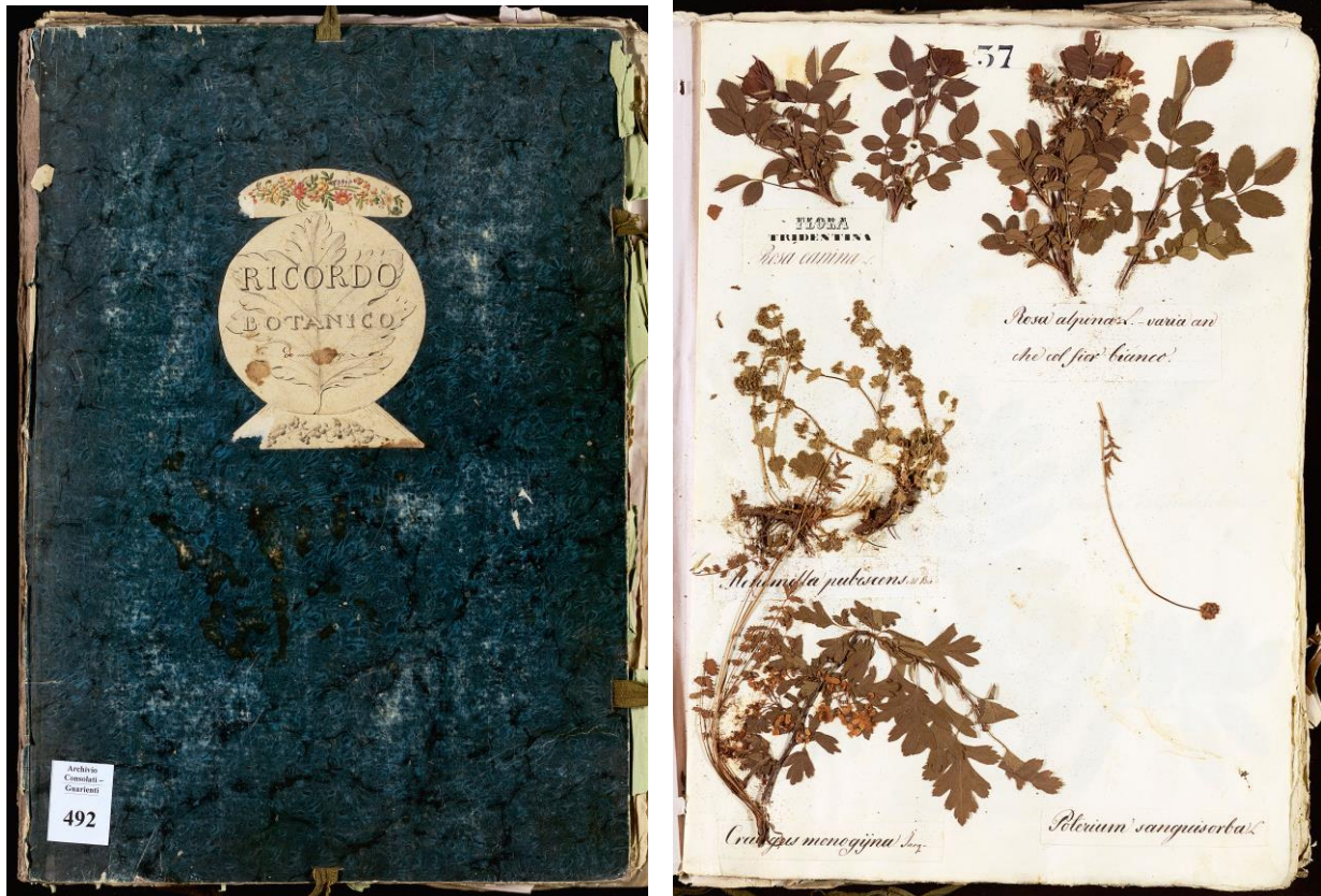
Erbario di Vincenzo Consolati, metà secolo XIX (Consolati, 492)

dalla cospicua raccolta di memorie di viaggio del periodo 1785-1904, al dettagliato diario di eventi pubblici, privati e meteorologici compilato per gli anni 1794-1806, ai carteggi privati fra parenti e amici, all'erbario composto alla metà dell'Ottocento dall'appassionato botanico Vincenzo Consolati, il fondo Consolati è una preziosissima miniera di dati e informazioni che aspettano di essere riscoperti e valorizzati.