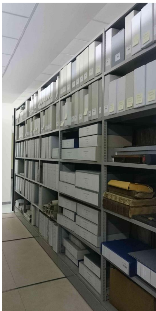
L'archivio dopo il riordino e il condizionamento negli appositi contenitori

I documenti dell'archivio sono ora liberamente consultabili presso l'Archivio provinciale di Trento (per orari e contatti https://www.cultura.trentino.it/Luoghi/Tutti-i-luoghi-della-cultura/Archivi/Archivio-provinciale-di-Trento ), insieme agli oltre 150 fondi di enti pubblici, enti privati, persone e famiglie che costituiscono il patrimonio dell'Istituto.